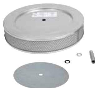
Optional - Filtro assoluto HEPA