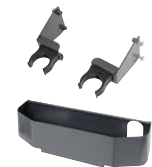
Optional - Portaccessori, portatubo