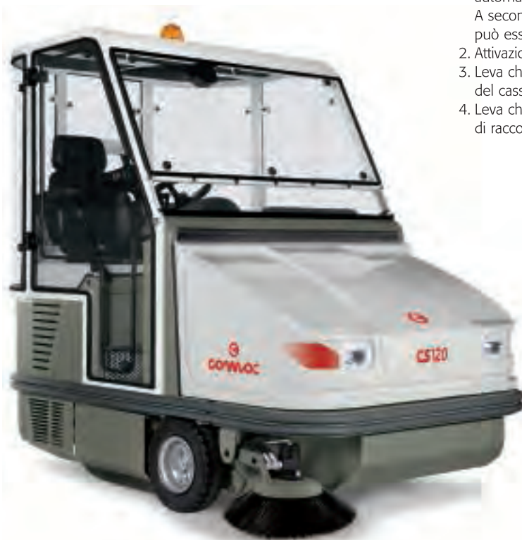
CS100/120 con cabina