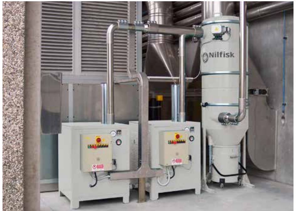
Impianto di aspirazione centralizzato: versione con 2 unità aspiranti ed 1 unità filtrante in azienda chimica

Gli impianti centralizzati sono la soluzione per l'aspirazione, contemporanea in più punti, in ambienti di estesi e con zone che hanno caratteristiche a volte molto diverse. Gli impianti certificati ATEX sono spesso la scelta obbligata per la grande produzione industriale.