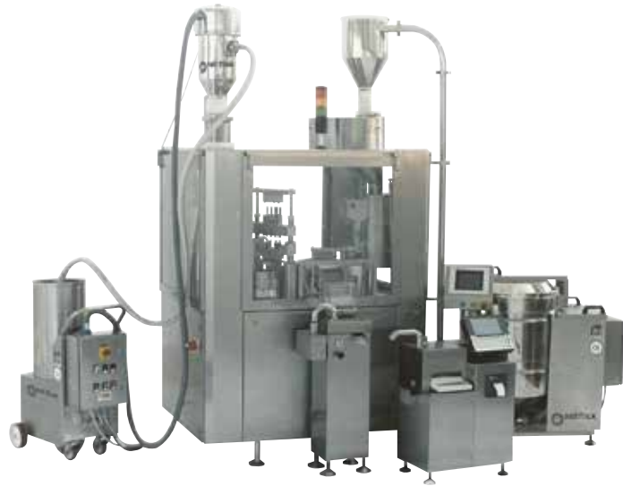
Trasportatore pneumatico (a sx) e spintore per capsule (a dx) su incapsulatrice in azienda farmaceutica.

I trasportatori pneumatici sono progettati per movimentare polveri e granuli da un punto ad un altro senza modificare la miscelazione. Tipico è l'utilizzo per l'alimentazione di macchine automatiche. Le versioni ATEX sono lo standard di sicurezza utilizzato nelle aree di produzione alimentare e chimico-farmaceutica.