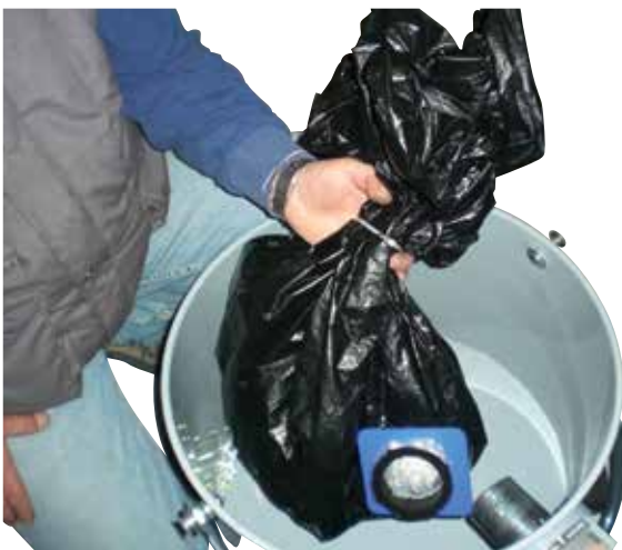
Filtro di sicurezza Safe Bag