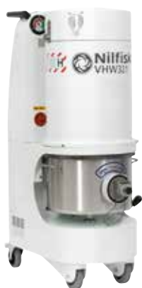
Trifase fino a 4 kW