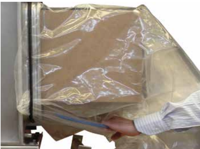
Sistema filtrante Bag-In Bag-Out