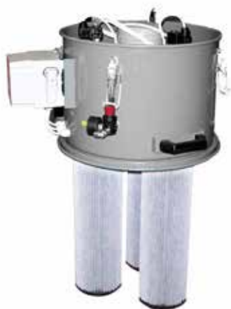
Filtro a cartucce