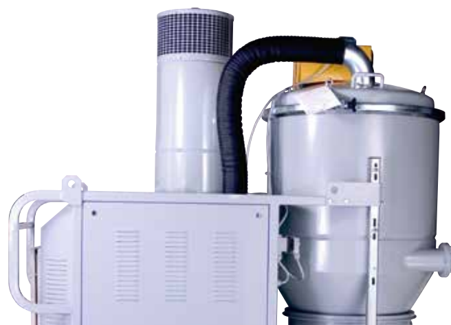
Diffusore per aria di scarico