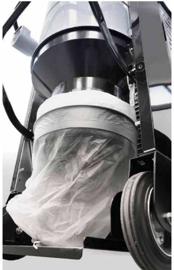
Sistema di scarico "senza fine" Longopac®