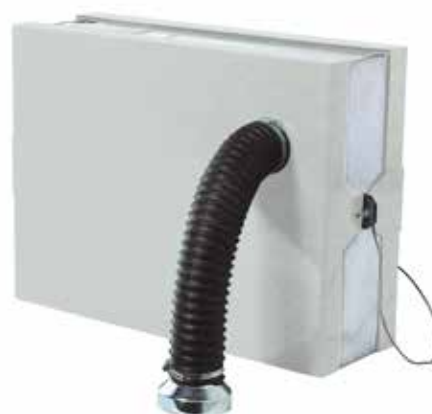
Filtro assoluto in soffiaggio