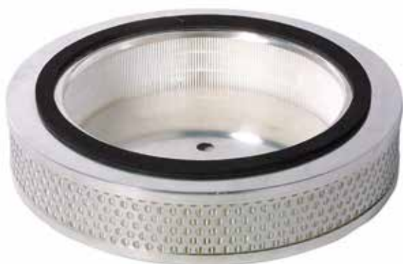
Filtro assoluto in aspirazione

Consulta il sito industrial-vacuum.nilfisk.it per ottenere gratuitamente i cataloghi accessori, optional e separatori: scoprirai la soluzione specifica per le tue esigenze.