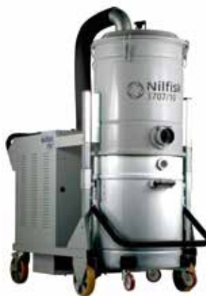
Trifase da 7.5 kW fino a 18.5 kW