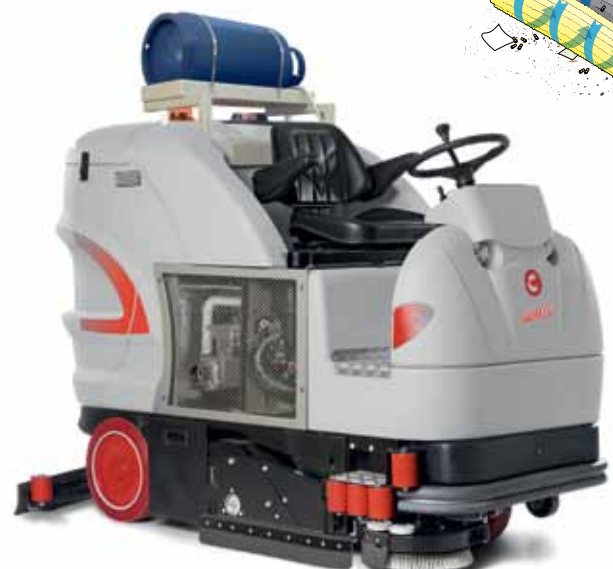
Ultra 100 GS