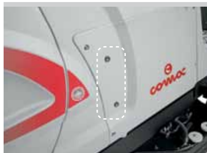
Indicatore di livello del liquido (versione con CDS)

Con il dosatore di acqua e detergente Comac CDS, si ha un risparmio della soluzione utilizzata fino al 50%