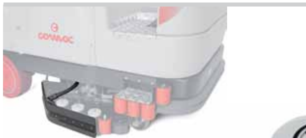
Sistema di aspirazione sulla testata lavante