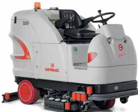
Ultra 120 B