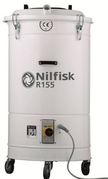
La foto mostrata potrebbe non corrispondere esattamente al modello offerto

Aspiratore industriale per aspirare ritagli plastici, cartacei o tessili. La potenza aspirante, le caratteristiche costruttive e le dimensioni sono ideali per essere utilizzati nei reparti di imballaggio.